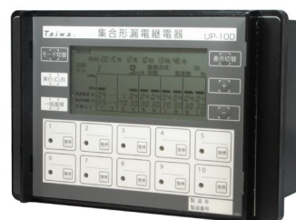
代替品候補の製品 UP-10D